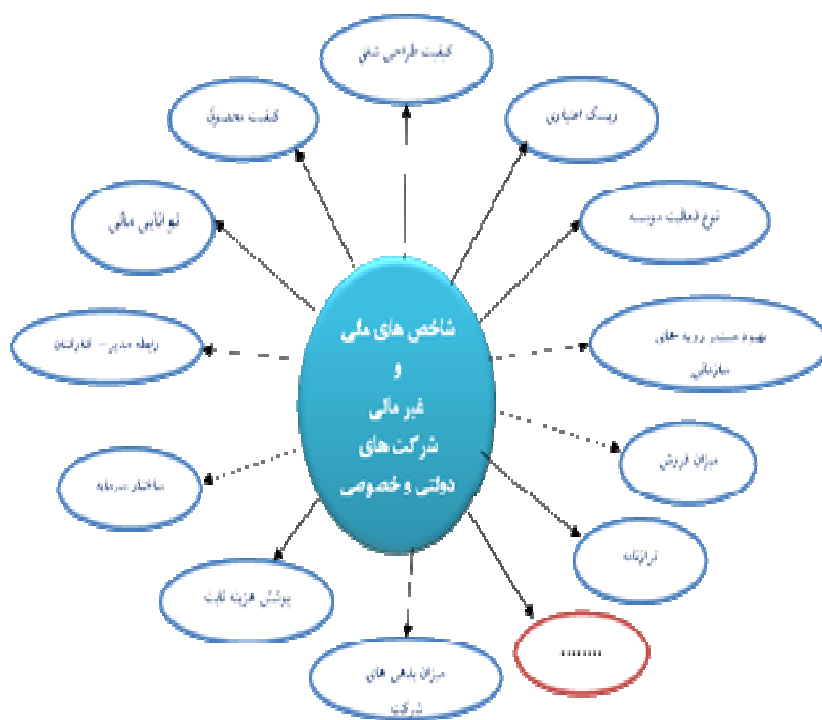
شکل (۱): مدل مفهومی تحقیق

از نوع کمی و یا از نوع کیفی می‌باشند. همچنین جهت بعضی از شاخص‌ها مثبت و بعضی دیگر منفی می‌باشد. مدل مفهومی تحقیق در شکل شماره ۱ آمده است: